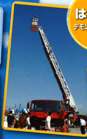
はしご車 デモンストレーション