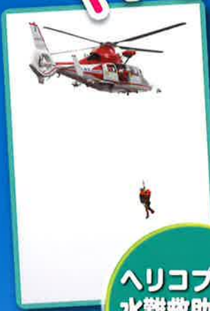
ヘリコプター 水難救助訓練 デモンストレーション