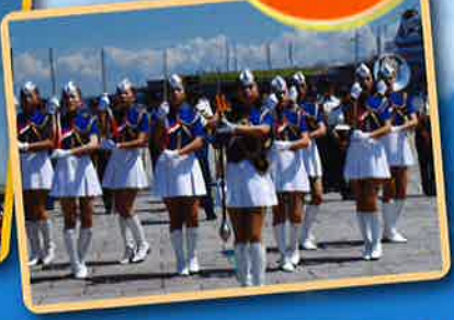
消防音楽隊 演奏 ドリル演技