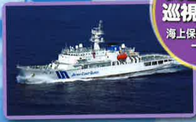
災害対応型 巡視船 いす 海上保安庁巡視船の 一般公開