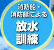
消防船・ 消防艇による 放水 訓練